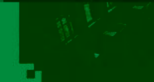
CNC 数控技术 训练场所